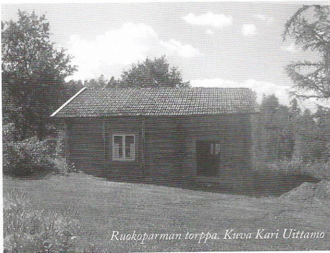
Ruokoparman torppa.

Ruokoparman torppa on varmasti monelle tuntematon paikka. Toki sammattalaisille tuttu nimi, samoin myös Elias Lönnrotiin hyvin perehtyneille. Niin tuttu hakuväline kuin google onkin, sieltäkään ei juuri vastausta saa.