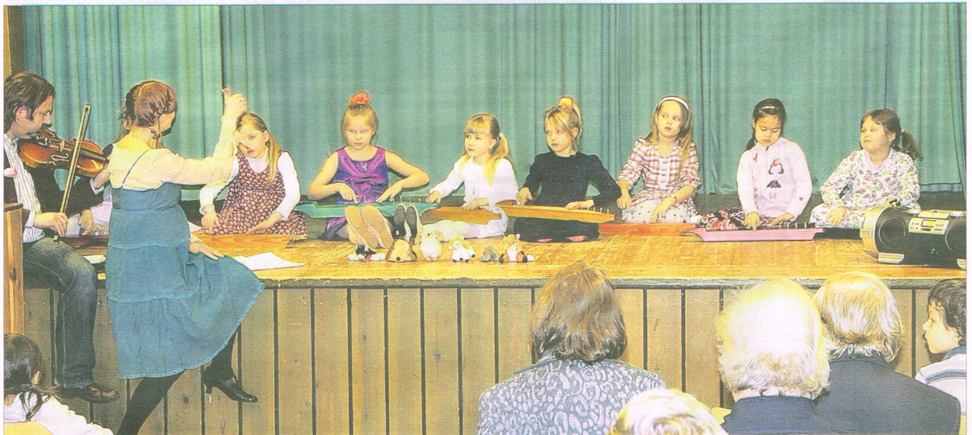
Pienten sammattilaisten kanteleensoittajien yhtye on saanut oppinsa Länsi-Uudenmaan musiikkiopiston suojissa.